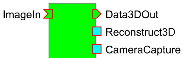
図 1 3 次元距離計測 RTC