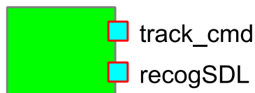
図 3 3次元運動認識テスト RTC